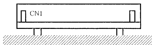
Mounting method (A)